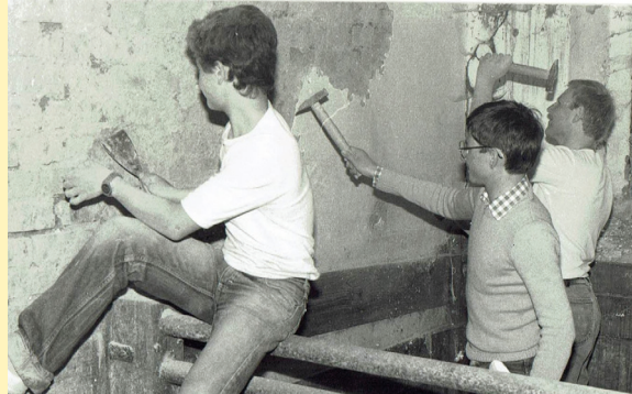
Kim-Jugend baut an ihrem KIM-Zentrum