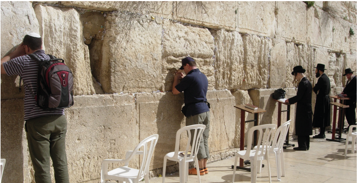
Dort wo einst der Tempel war, befindet sich heute die Klagemauer – für Juden eine wichtige Gebetsstätte

Will-Haben“, „Unterhaltung“, „mein Vergnügen“, „Rausch“. Sie ließen sich davon gefangen nehmen. Sie lieferten sich diesen Ansprüchen geradezu aus, sie glaubten daran. In dieser vom „Haben“ geprägten Welt gab es aber auch Ausnahmen. Es gab solche, die nach dem suchten, was wahren Halt gibt. Sie fanden es in der jüdischen Spiritualität.