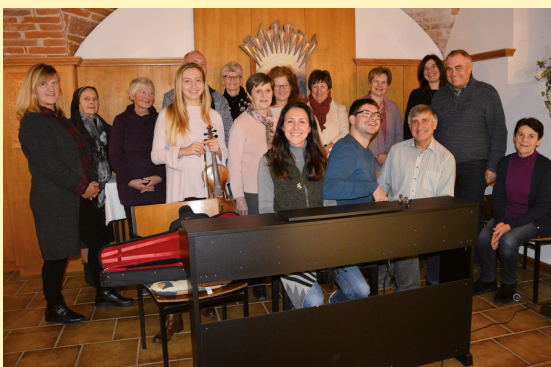
Gebetsabend im KIM-Zentrum