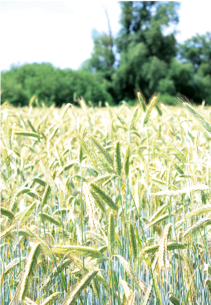
Erst wenn das Weizenkorn stirbt, bringt es reiche Frucht

2,4) Noch vor sechs Monaten beim Laubhüttenfest (Okt. 29 n.Chr.) war auch die Zeit noch nicht gekommen. Damals trat Jesus trotz Morddrohungen unbehelligt öffentlich im Tempel auf. „Doch keiner legte Hand an ihn, denn seine Stunde war noch nicht gekommen.“ (Joh 7,30)